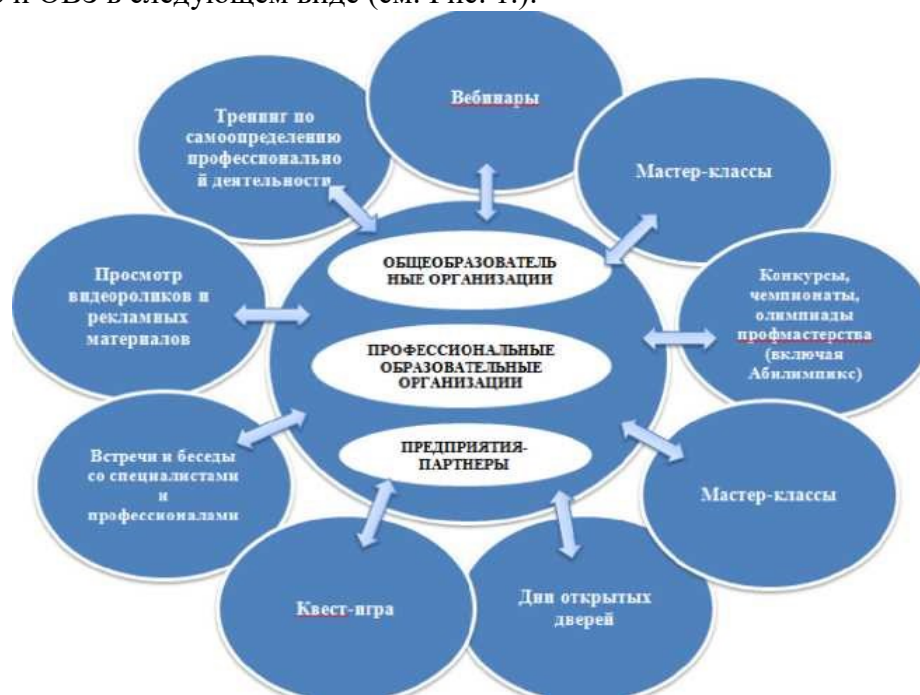
Рис. 1. Основные мероприятия профориентации обучающихся с ограниченными возможностями здоровья и инвалидностью.

Профессиональная ориентация лиц с инвалидностью и ограниченными возможностями здоровья осуществляется как на базе школ, так и базе профессионального образовательного учреждения, а также на базе потенциального работодателя. При этом знакомство с профессиями и специальностями проводится специалистами, преподавателями, психологами колледжа, школы, непосредственно работодателями, предпринимателями, которые могут предоставить непосредственное и четкое представление о профессиональной деятельности. Таким образом, можно представить мероприятия по профориентации лиц с инвалидностью и ОВЗ в следующем виде (см. Рис. 1.):