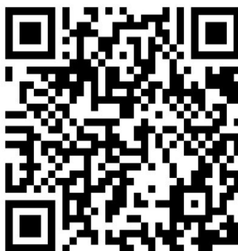
Рис.1. QR-код (ссылка) на программу и методические материалы, используемые при реализации практики

С программой и методическими материалами, которые используются при реализации практики, можно ознакомиться по QR-коду (Рис.1.).